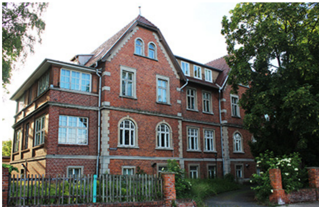
Zu verkaufen: Das bebaute Grundstück in der Bornhövedstraße 78.

Dieses und weitere Grundstücksangebote der Stadt Schwerin finden Sie auch unter www.schwerin.de/immobilien .