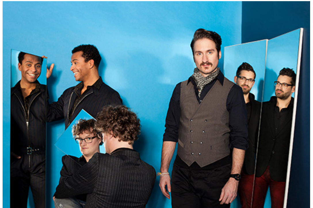
Die vier Stimmen von DeltaQ

Zu erleben ist mit den medlz eine der erfolgreichsten weiblichen A-Cappella-Bands Europas. Sie lädt zu einer außergewöhnlichen und leidenschaftlichen Reise durch 200 Jahre Musikgeschichte ein. Genießen Sie die außergewöhnliche „Stecknadel“-Stille bei Mozart's Ave Verum, spüren Sie den Soul bei Spiritual Oh happy Day, lassen Sie sich von vier Marilyn Monroes im Medley küssen und tanken Sie Kraft bei gutem Pop, z. B. mit „Das Boot“ oder „Who wants to live forever“... 1999 gründete sich mit den medlz eine der erfolgreichsten weiblichen A-Cappella-Bands. 2012 wurden sie mit der „Freiburger Leiter“ ausgezeichnet, dem Preis der Fachbesucher der Internationalen Kulturbörse Freiburg für den besten Auftritt im Bereich Musik. Beim Internationalen A-Cappella-Wettbewerb in Graz belegten sie 2013 in der Kategorie Pop den zweiten Platz. 2014 hatten die medlz mit 15 Konzerten und rund 6000 Besuchern ihre bisher erfolgreichste Weihnachtstour. Auch das Programm „medlz - bekannt aus Film