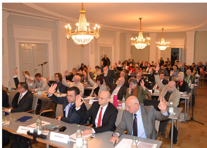
Stadtvertreterinnen und Stadtvertreter bei der Abstimmung während einer Sitzung im Demmlersaal des Rathauses.