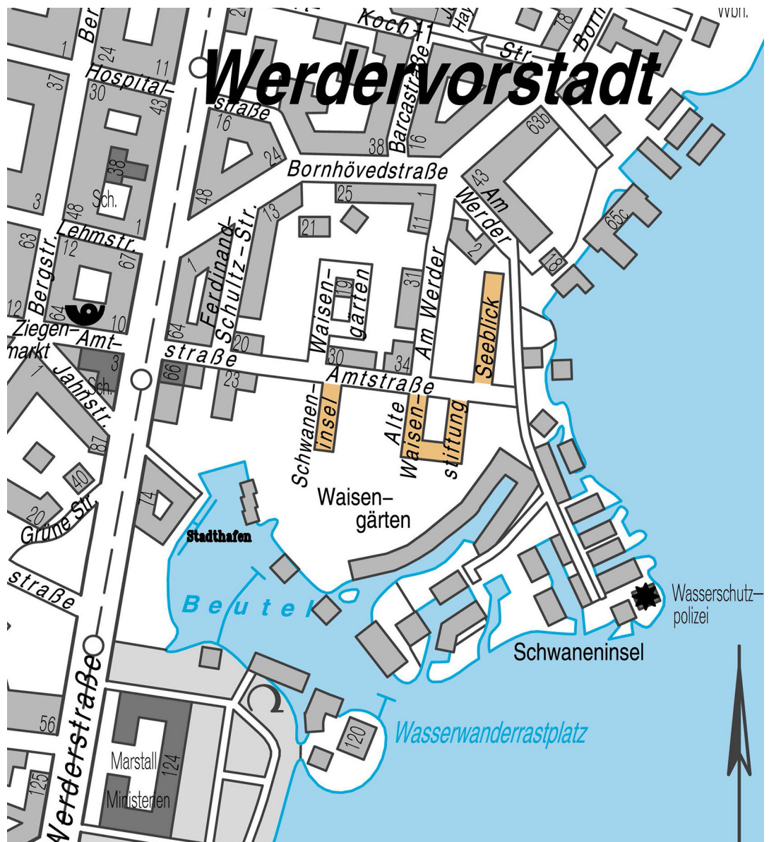
Straßenbenennung Bebauungsplan 77.11 „Alte Waisenstiftung“