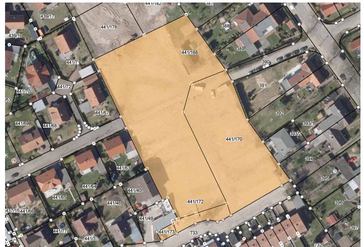
Das zum Verkauf stehende Grundstück im Stadtteil Neumühle soll als Wohngebiet entwickelt werden.

Diese und weitere Grundstücksangebote der Stadt Schwerin finden Sie auch unter www.schwerin.de/immobilien .