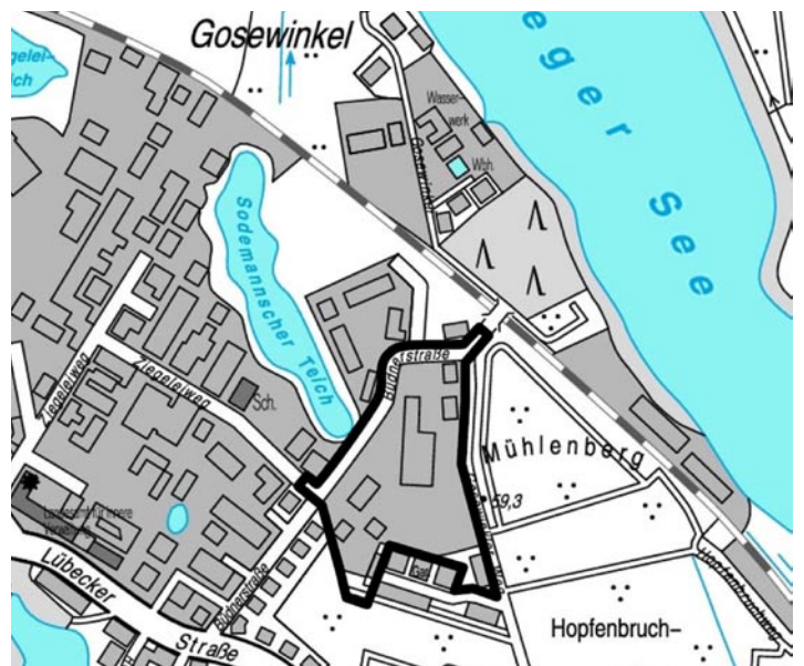
Bebauungsplan Nr. 84.13 „Am Sodemannschen Teich“ gemäß § 3 (1) BauGB