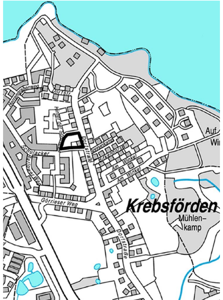
1. Änderung des Bebauungsplanes Nr. 31.98.01 „Krebsförden Dorfstraße“