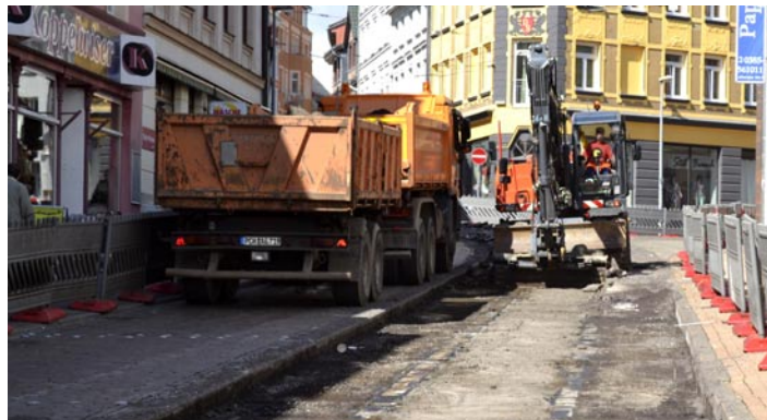
Bis Oktober sollen die Bauarbeiten in der Lübecker Straße abgeschlossen sein.