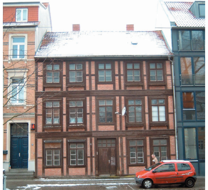
Steht zum Verkauf: das Grundstück in der Goethestraße 4

Voraussetzung für die Veräußerung des Grundstückes ist die Bereitschaft des Erwerbers, die städtischen Sanierungsziele umzusetzen. In diesem Zusammenhang wird darauf hingewiesen, dass es für die Grundstücke in förmlich festgesetzten Sanierungsgebieten verbesserte steuerliche Abschreibungsmöglichkeiten gibt. Dieses gilt sowohl für eigengenutzte als auch für fremdgenutzte Grundstücke. Mehr Informationen zu den Fördermöglichkeiten in den Sanierungsgebieten unter www.schwerin.de/stadterneuerung . Interessenten für den Erwerb und die Sanierung der Grundstücke wenden sich bitte innerhalb von vier Wochen nach der Veröffentlichung dieses Inserates an die Landeshauptstadt Schwerin, Amt für Liegenschaften, Am Packhof 2-6, 19053 Schwerin, Frau Czerwinski, (0385) 545-1622, E-Mail: rczerwinski@schw